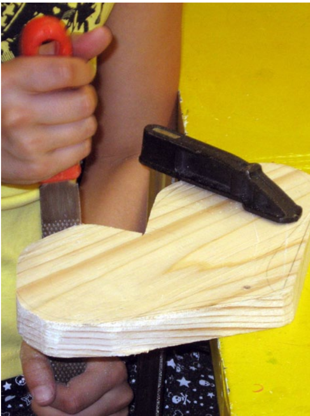
Holz sägearbeiten (Öko-Werkstatt)

Wir stellen spezielle Spiele (z. B. Spiel des Wissens , Welche wird Millionärin , Puzzles usw.) zur Verfügung und zeigen den Mädchen für sie interessante Seiten (z. B. Lizzy-Net – die Seite von Mädchen für Mädchen) im Netz.