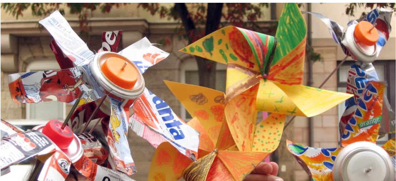
Windräder aus alten Metalldosen und Papierabfällen aus einer Druckereispende (Öko-Werkstatt)

Hier finden niedrigschwellige Angebote statt, d. h. die Angebote sind offen für alle, kosten nichts, und