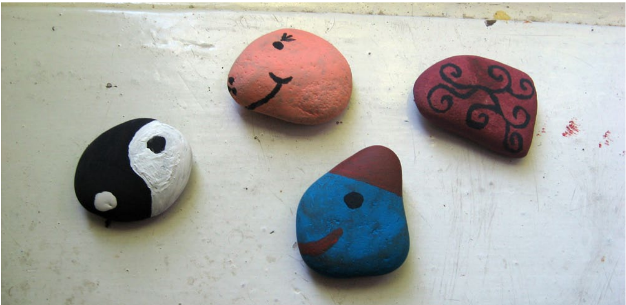
Handbemalte Findlinge (Öko-Werkstatt)

Auch wenn die Lebensweisen in sich sehr differieren, hat die ethnische Zugehörigkeit Einfluss auf den Zugang zu gesellschaftlichen Ressourcen. Bildungsbeteiligung, Bildungsabschlüsse, beruflicher Status der Eltern und die sozioökonomische Lage unterscheiden sich bei jungen Menschen mit und ohne Migrationshintergrund. Insgesamt betrachtet erreichen Jugendliche mit Migrationshintergrund