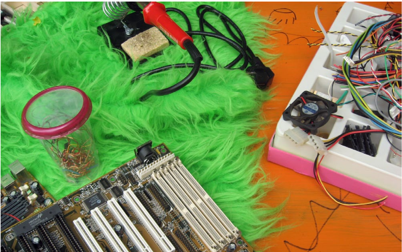
PC-Werkstatt: Was steckt in einem PC? In der Öko-Werkstatt wird aus Computer-Bauteilen Schmuck hergestellt

Der Begriff Mädchen mit Migrationshintergrund ist ein Konstrukt, um diese Gruppe, die sich durch eine große Heterogenität auszeichnet, erfassen zu können. Ihre Familien sind aus den unterschiedlichsten Gründen eingewandert. Als klassische Arbeitsmigrantinnen und -migranten, als Flücht-