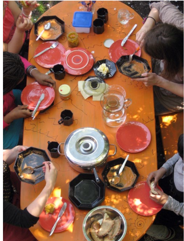
Mittagsimbiss im Garten

Mit hungrigem Magen lernt es sich schlecht – der Mittagsimbiss bietet den Mädchen die Gelegen-