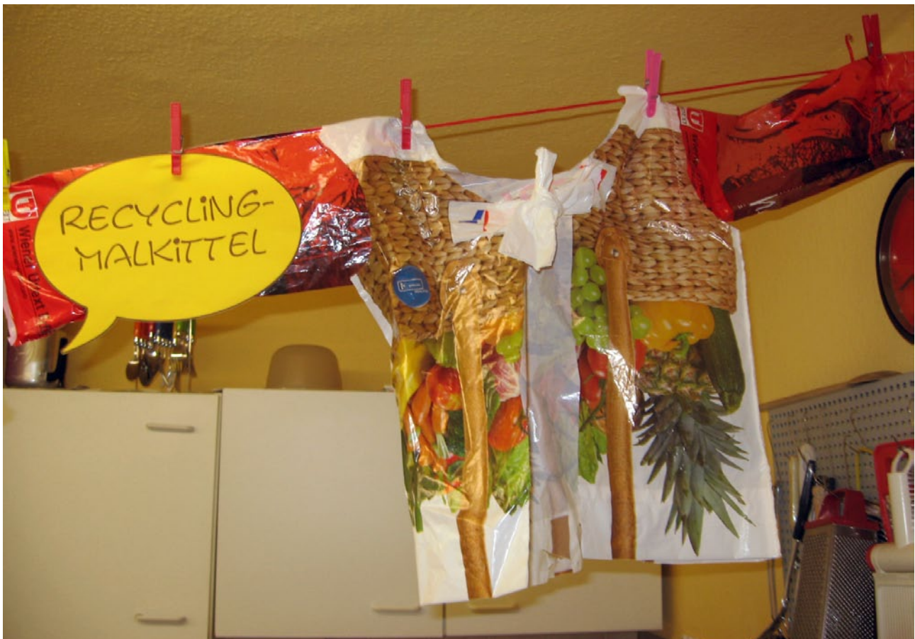
Malkittel aus Plastiktüten

Die Kürze dieses Abschnitts spiegelt die Knappheit unserer finanziellen Mittel wider, nicht aber den Aufwand, der zur Gelderbeschaffung nötig ist.