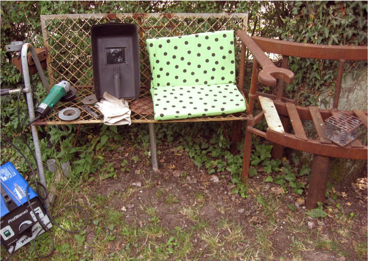
Gartenbank aus Eisenschrott, entstanden im Schweißkurs