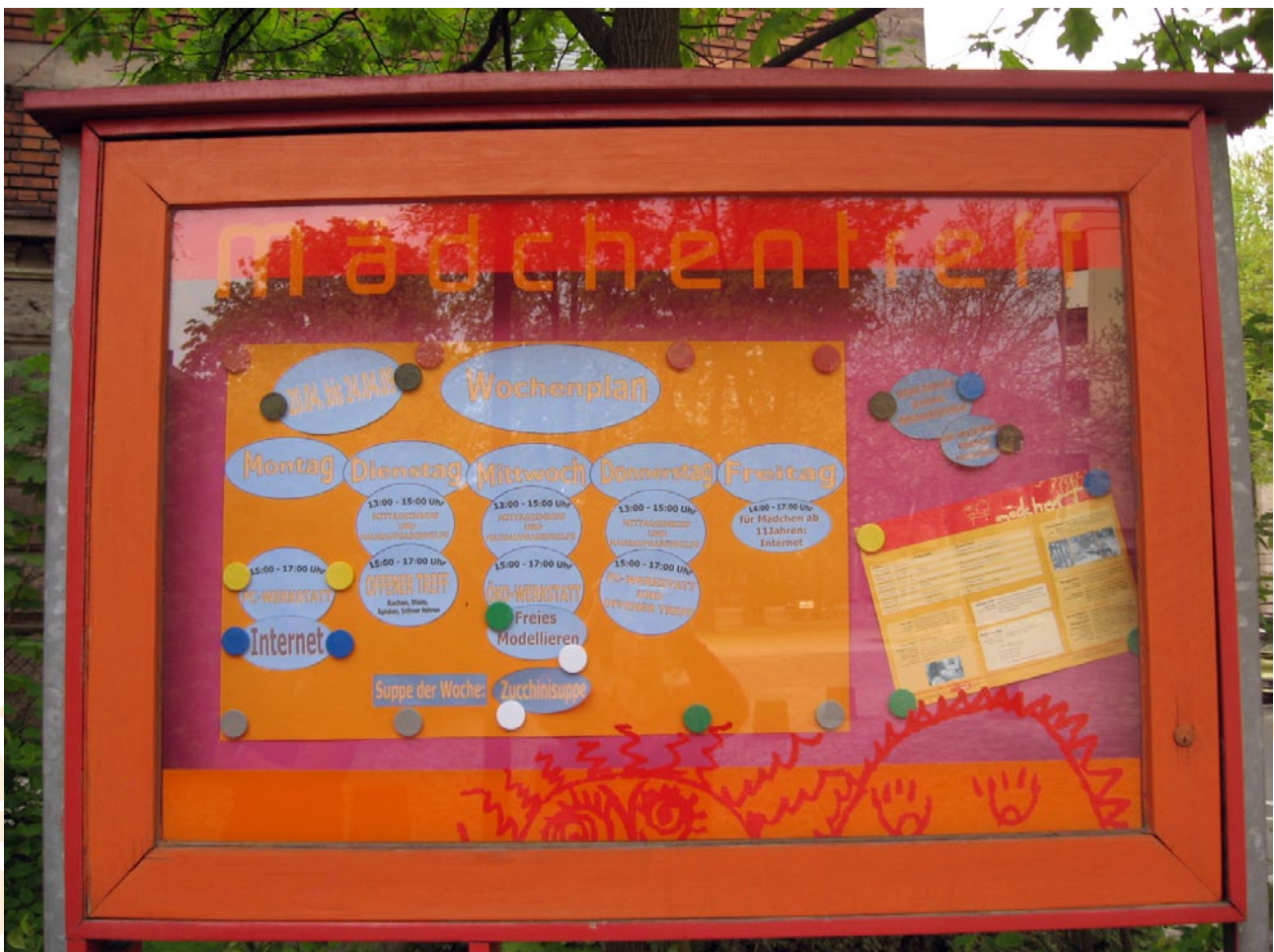
Schaukasten mit Wochenplan

Der Offene Treff ist für alle Mädchen ab sechs Jahren geöffnet. Eine Gelegenheit, gemeinsam mit einer Freundin zu spielen, sich Bücher auszuleihen, im Theaterraum Musik zu hören und zu tanzen, Federball zu spielen, sich Inliner auszuleihen, am gemeinsamen Kochen teilzunehmen, die Computer