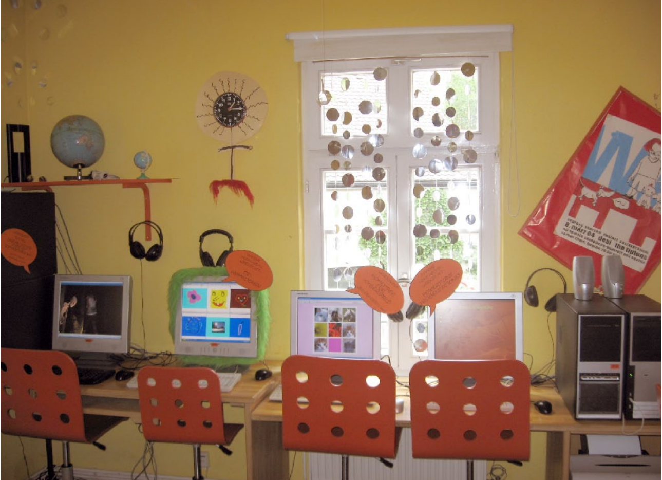
PC-Werkstatt und Internetcafé