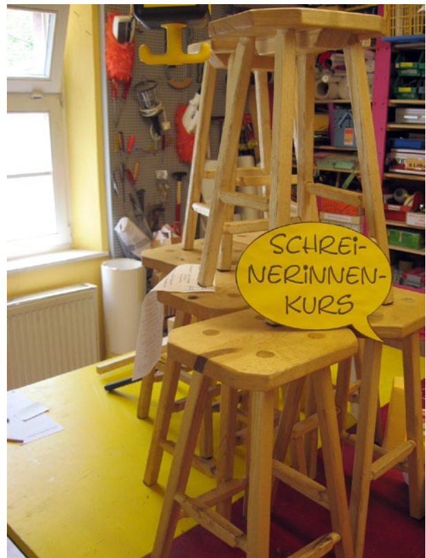
Werkstatthocker gebaut im Schreinerinnenkurs

Die Teilnahme an den Angeboten des Mädchentreffs ist freiwillig und soll nicht als Pflicht oder gar als Zwang gesehen werden.