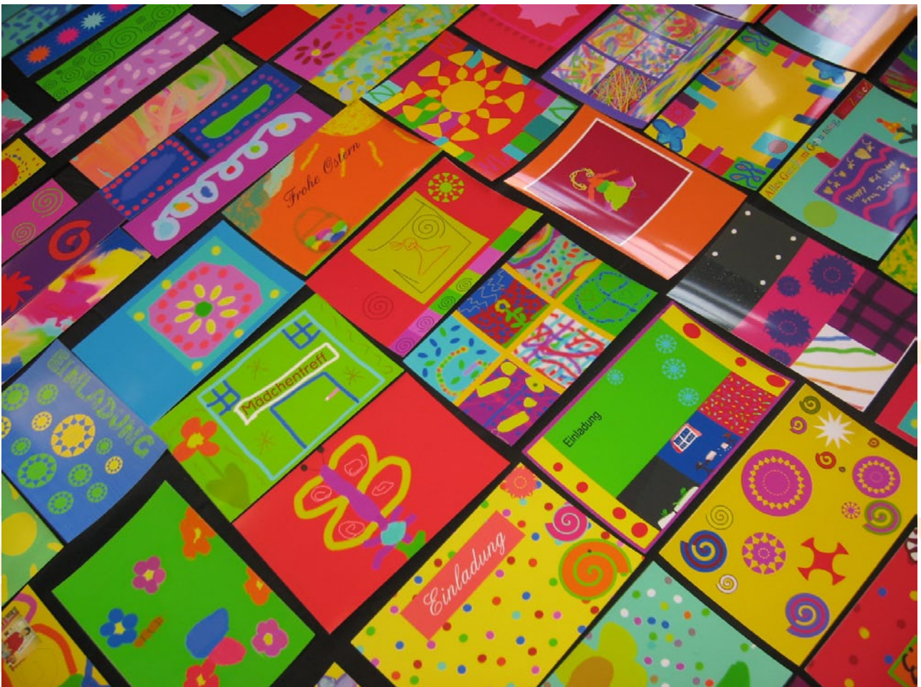
Postkarten und Lesezeichen von Mädchen in der PC-Werkstatt gestaltet

essen, Freizeitgestaltung, Berufswahl und Zukunftsplanung offen. Trotzdem ist die soziale Ungleichheit nicht aufgehoben. Die Lebensentwürfe von Mädchen und ihre Teilhabechancen an den Ressourcen unserer Gesellschaft sind abhängig von ihrer Position in der sozialen Ordnung. Sie wird bestimmt durch die Zugehörigkeit zur Altersgruppe, durch die sozioökonomische Lage, die ethnische Zugehörigkeit und die regionalen Bedingungen. Der Zugang zu Ressourcen wie Bildung, Geld, sozialem Status, Erwerbsarbeit etc. ist nicht nur zwischen männlichen und weiblichen Jugendlichen sehr ungleich verteilt und damit zurückzuführen auf soziale Ungleichheiten im Geschlechterverhältnis, sondern auch zwischen weiblichen Jugendlichen selbst. Das heißt, dass viele Mädchen im Vergleich zu Jungen deutlich schlechter, aber auch besser gestellt sein können. Zudem werden innerhalb